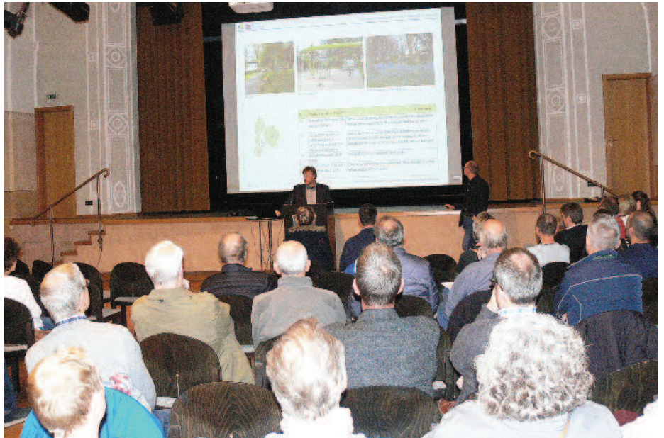
Gut besucht und reges Interesse fand die Abschlussveranstaltung „Zukunft Stadtgrün“ in der Homberger Stadthalle mit rund 50 Besuchern. Foto: Uwe Dittmer

Ein mögliches Projekt: der Bau eines neuen Gemeindehauses der Katholischen Kirche am Stadtspark (1) mit zwei Vorteilen: bessere soziale Kontrolle des Stadtsparkbereichs, gemeinsame Nutzung von Toiletten und eines Cafés. Und ein barrierefreier Zugang zur Kirche (2). Foto: Dittmer/Plan: foundation 5+ u. akp