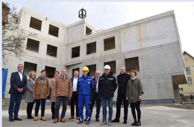
Es ist geschafft: der Rohbau steht und alle Beteiligten freuen sich.

Die Hermann-Schafft-Schule (HSS) ist eine Schule mit den Förderschwerpunkten Hören und Kommunikation sowie Sehen. Sie ist eine von 15 Förderschulen des LWV