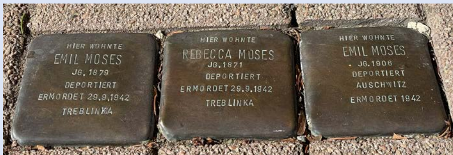
Stolpersteine vor der Bischofstraße 5

Nach der Zerstörung Jerusalems und des jüdischen Tempels im Jahre 70 n. Chr. wurden die Juden aus ihrer Heimat Israel vertrieben. In anderen Ländern suchten