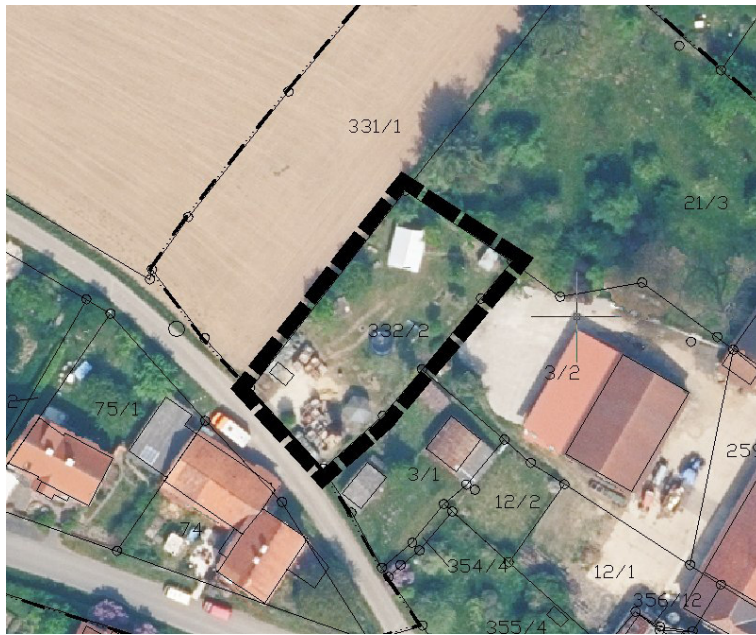
Abb. 2: Lageplan mit Luftbild

Das Plangebiet liegt am westlichen Ortsrand von Mardorf. Der Geltungsbereich umfasst das Grundstück Gemarkung Mardorf Flur 7 Flurstück 332/2 entsprechend dem oben dargestellten Übersichtsplan. Die Größe des Geltungsbereiches beträgt ca. 830 m 2 .