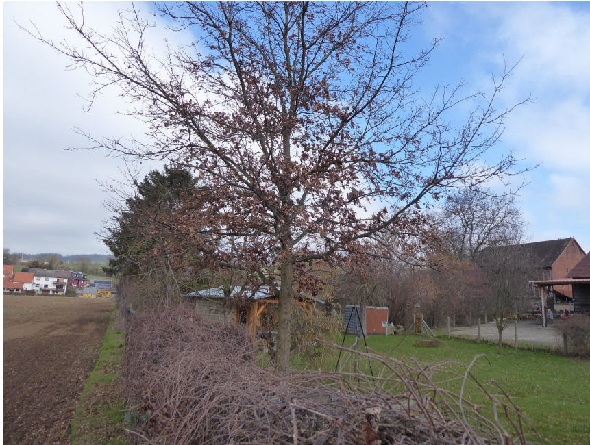
Abb. 3: Geplantes Baugrundstück

Der Geltungsbereich der Satzung wird derzeit als Garten mit großenteils intensiven Rasenflächen genutzt. Auf der Fläche befindet sich eine alte Eiche, die erhalten werden muss. Weiterhin befinden sich dort einige jüngere Gehölze (Hainbuche, Eiche, Kirsche), die ebenfalls erhalten oder auf dem Flurstück umgesetzt werden sollen.