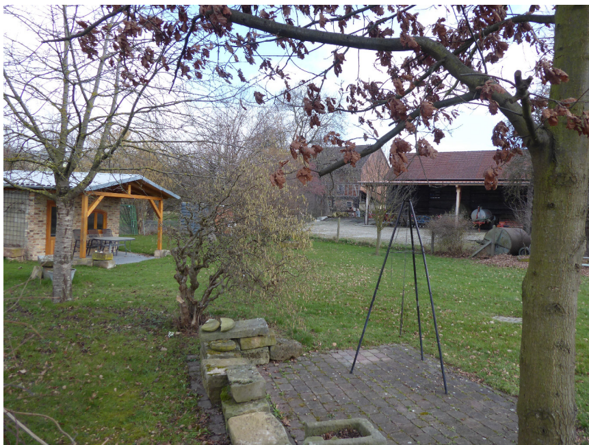
Abb. 4: Geplantes Baugrundstück mit Gartenhütte