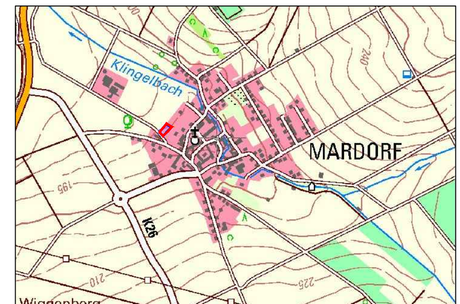
Übersichtslageplan (aus: TOP 50 Hess. Amt für Bodenmanagement o.M.)